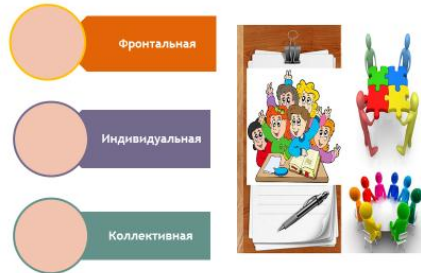
Слайд 1 (формы обучения)