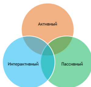
Слайд 5 (методы обучения)