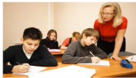
Слайд 3 (индивидуальная форма)