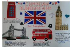
Слайд 10 (проектная методика)

Для организации проектной деятельности можно использовать создание стенгазет. Процесс создания проекта называется проектированием.