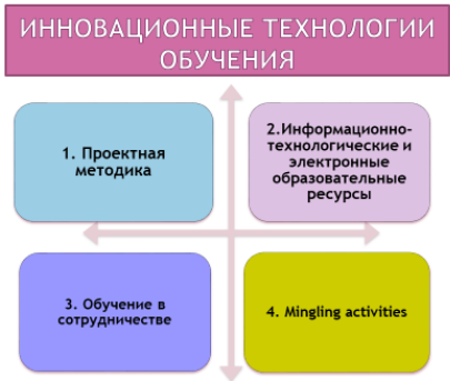
Слайд 9 (инновационные технологии обучения)