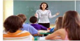
Слайд 2 (фронтальная форма работы)