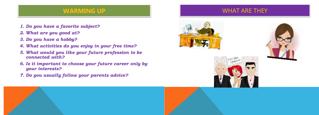
Слайд 3 Слайд 4