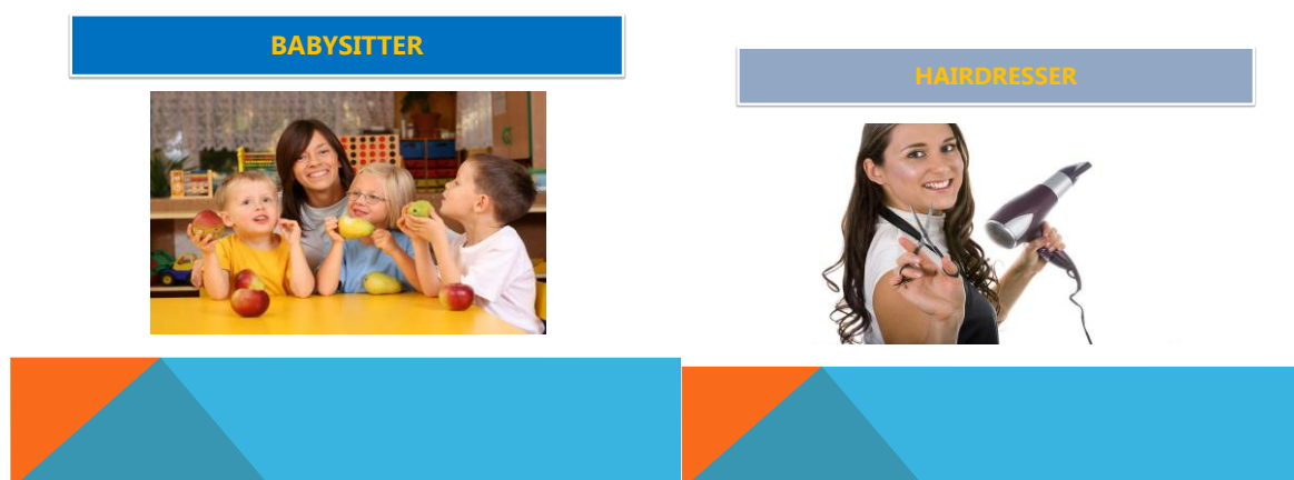
Слайд 5 Слайд 6