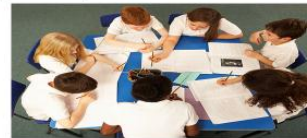
Слайд 4 (коллективная форма)