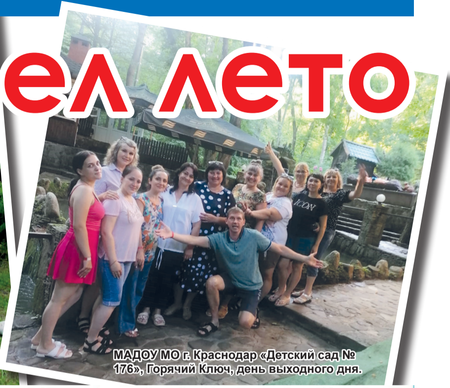
МАДОУ МО г.Краснодар «Детский сад № 176», Горячий Ключ, день выходного дня.