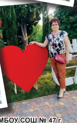
МБОУ СОШ № 47 г. Саки, июль 2022