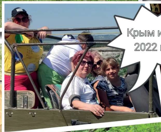
Крым июнь 2022 год