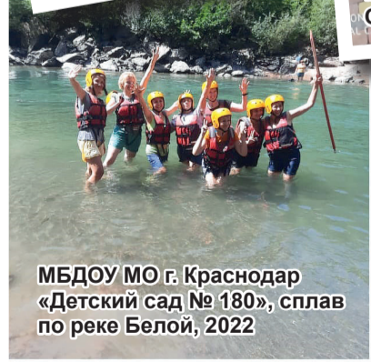
МБДОУ МО г.Краснодар «Детский сад № 180», сплав по реке Белой, 2022