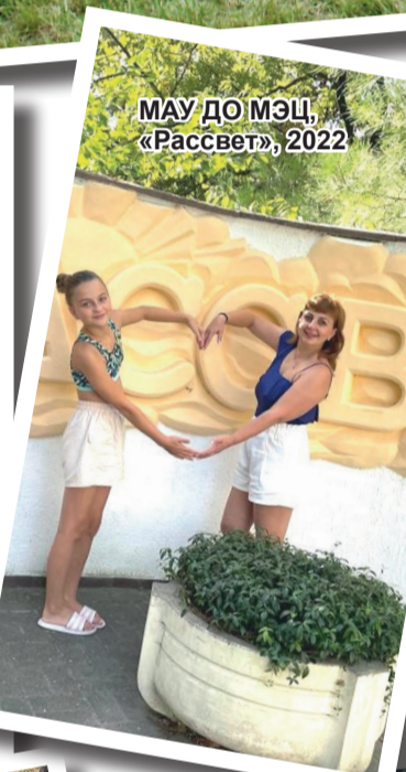
МАУ ДО МЭЦ, «Рассвет», 2022