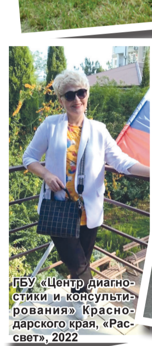
ГБУ «Центр диагностики и консультирования» Краснодарского края, «Рассвет», 2022