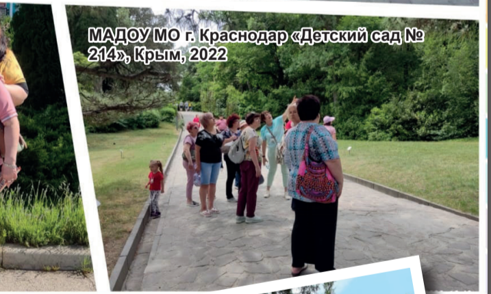
МАДОУ МО г.Краснодар «Детский сад № 214», Крым, 2022