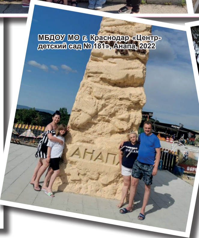
МБДОУ МО г.Краснодар «Центр-детский сад № 181», Анапа, 2022