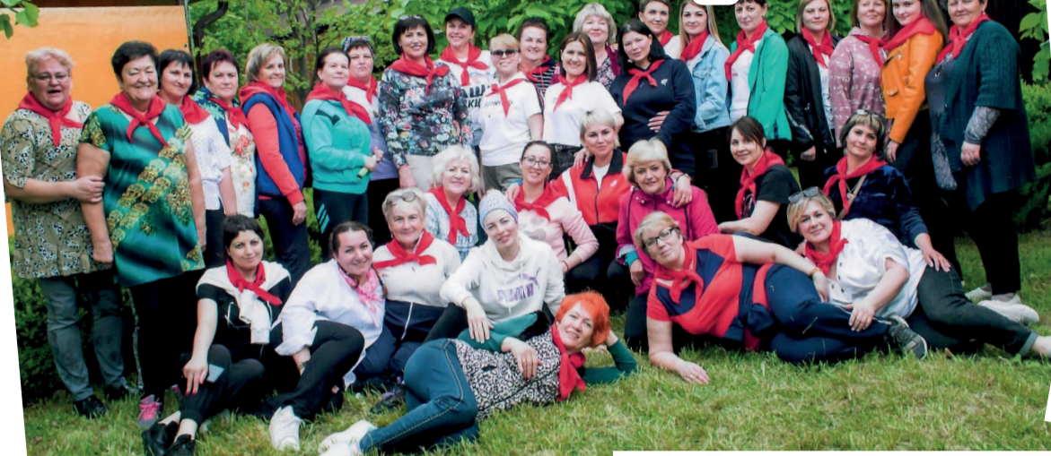
МБДОУ МО г.Краснодар «Детский сад № 85», юбилей учреждения, хутор Ленина, «Лесная сказка».