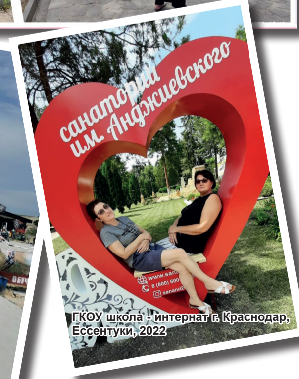
ГКОУ школа - интернат г.Краснодар, Ессентуки, 2022